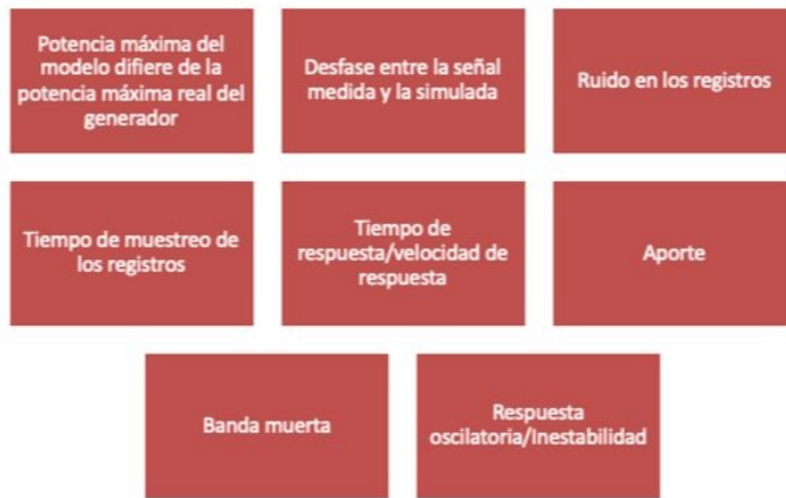
Figura 3. Patrones definidos para el seguimiento a modelos.

A partir de la reunión de revisión se definirá si la respuesta inadecuada del modelo puede ser resuelta a través de un reajuste de parámetros o si se requiere actualizar el modelo de control. Para el primer caso, el CND en conjunto con el agente realizarán un ajuste del modelo sin la obligatoriedad de realizar pruebas adicionales. Luego del ajuste del modelo se continuará con el proceso de seguimiento como si hubiese sido actualizado el modelo. En caso de que se realice en dos ocasiones consecutivas el ajuste de los parámetros del modelo y no se logre el cumplimiento de indicadores asociados a un mismo patrón, será necesario realizar una actualización del modelo teniendo en cuenta los plazos definidos en el artículo sexto del presente Acuerdo para el caso de Desempeño inadecuado de modelos. Adicionalmente, el CND deshabilitará los modelos de control en el modelo eléctrico oficial del SIN.